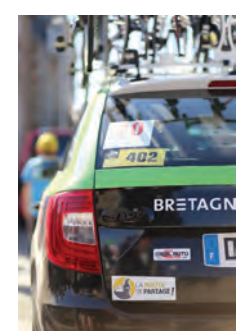
ÉQUIPE BRETAGNE SÉCHÉ ENVIRONNEMENT